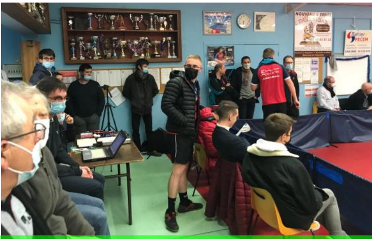
Un grand merci aux supporters sans qui, rien n’aurait été possible

Ce samedi 11 décembre, Beaufou de retour en terre mayennaise, jouait sa « survie » dans ce championnat et se trouvait dans l’obligation de gagner.