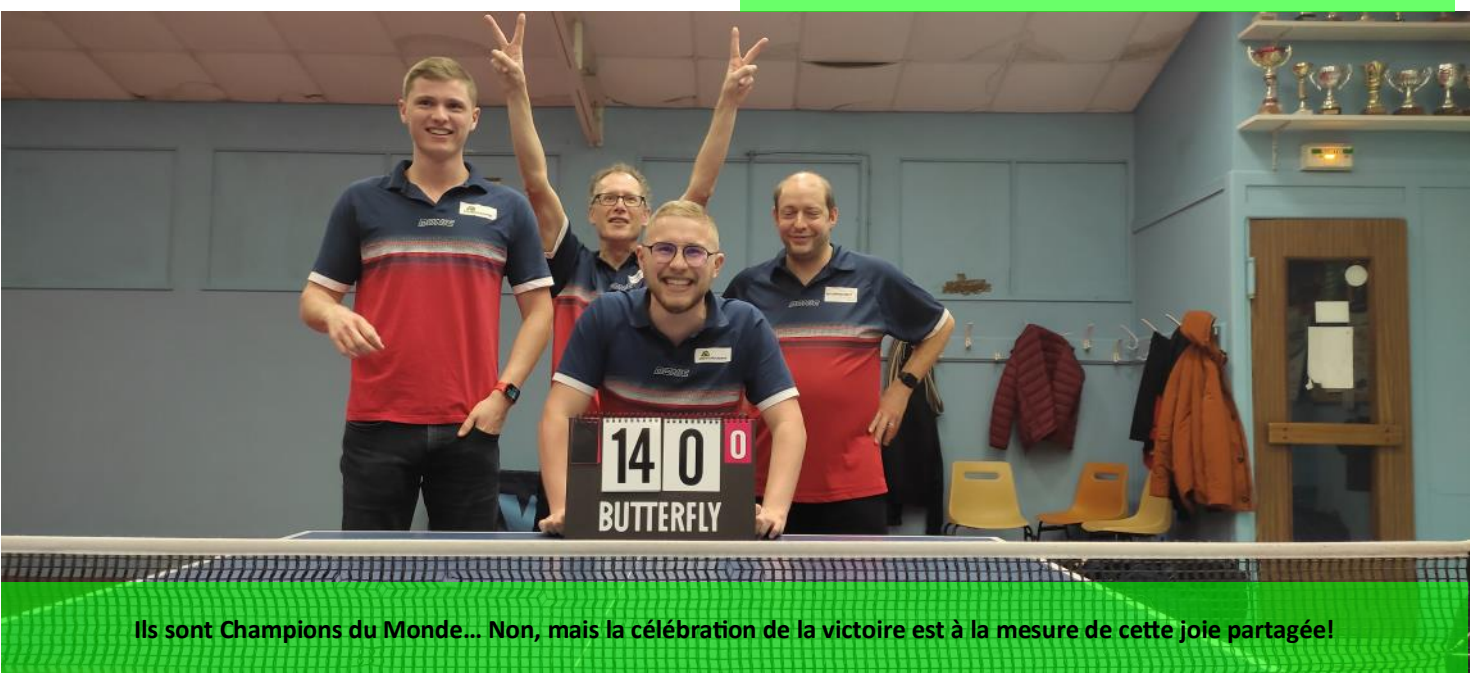
Ils sont Champions du Monde... Non, mais la célébration de la victoire est à la mesure de cette joie partagée!